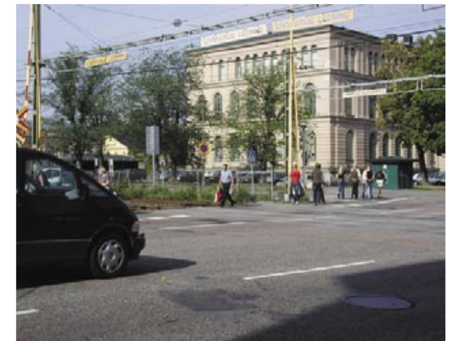
Skolhusallén, den korsning där flest fotgängare passerar järnvägen.