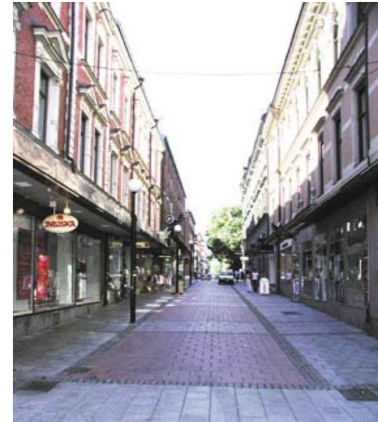
Thulegatan sett mot söder från korsningen med Storgatan