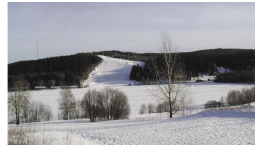
Sidsjön med slalombacken

I Sidsjön sker även utplantering av fisk vilket gör området till ett av stadens mest centrala fiskeområden. Vid Sidsjön finns även en slalombacke. Sidsjön är ett kommunalt naturreservat.