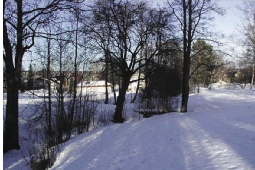
Grevensbäcken söder om Björneborgsgatan

Grevensbäcken och Stavsättsbäcken som ligger i områdets östra del är kulverterade på avnippet norr om Björneborgsgatan. Bäckarna rinner ut i Sundsvallsfjärden.