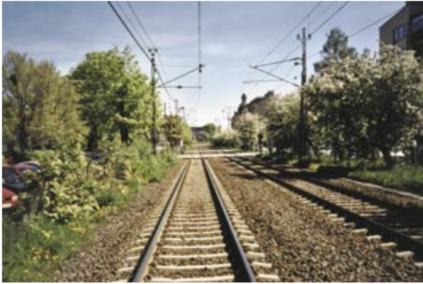
Blommande äppelträd utefter järnvägen