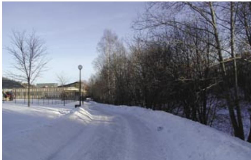
Promenad- och cykelstråk utefter Selångersån

Promenadstråk finns utefter Selångersån, Sidsjöbacken och Grevensbäck- en (söder om Björneborgsgatan).