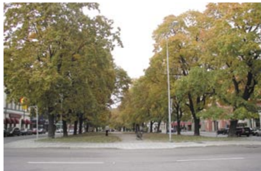
Esplanaden är en viktig del i Sundsvalls gröonstruktur. Här ses Esplanaden från Köpmangatan norrut.