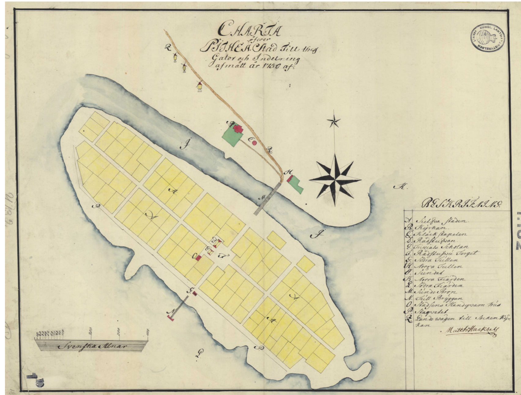
Figur 8. Piteå år 1750. Lantmäteristyrelsens arkiv, akt Å28-1:10.

Piteåborgarna hade i princip ensamrätt på handel med allmogen i omgivande socknar och handeln skedde i regel på de fasta marknadsplatser och bytesställen som fanns i Arvidsjaur, Arjeplog, Skellefteå, Burträsk samt Storkåge. Handeln var främst förlagd till de tre fasta marknadsterminer som återkom varje vår, höst och vinter. Båda broarna in i staden – från Pitholmen i öster och från Norrmalm i norr – var försedda med tullbommar och för den skeppsburna handeln fanns det två tullbryggor. Den så kallade inre tullen, som innebar en tullavgift på varor som fördes in och ut mellan staden och landsbygden, gällde i hela Sverige och fanns kvar till 1810.