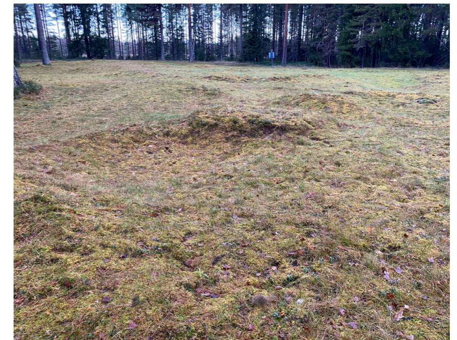
Figur 7. Bebyggelse lämningar i Gamla Kyrkbyn.