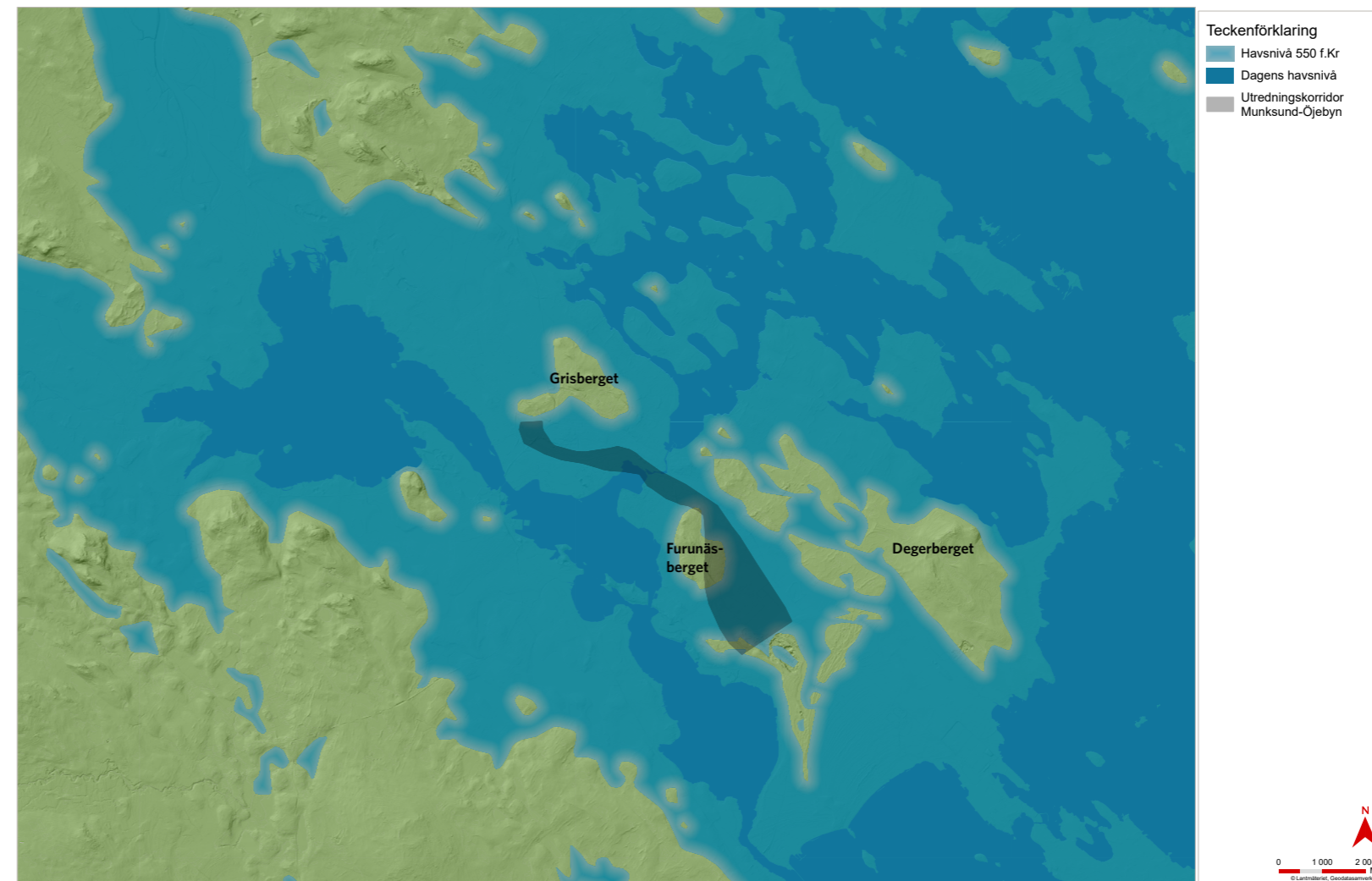
Figur 5. Strandnivåkarta ca 550 f.Kr.

Under 1900-talet – inte minst från 1960-talet och framåt – har Pitholms ägor till stor del exploaterats för nya bostadsområden. Många bytomter är idag övergivna och det kvarvarande odlingslandskapet har delvis vuxit igen i takt med att de flesta jordbruket har lagt ner. De östra delarna av byn har dock behållit en relativt hög grad av den gamla småskaliga bykaraktären, med något glesare gårdsbebyggelse och brukad åkermark.