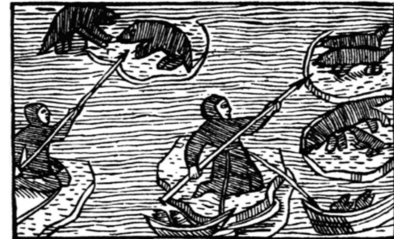
Figur 3. Säljakt. Ur Olaus Magnus "Historia om de nordiska folken" från 1555.

Utredningsområdet och den närmaste omgivningen saknar helt kända fornlämningar som med säkerhet kan härledas till bronsåldern. I Jävre, två mil söder om Piteå, finns däremot en stor