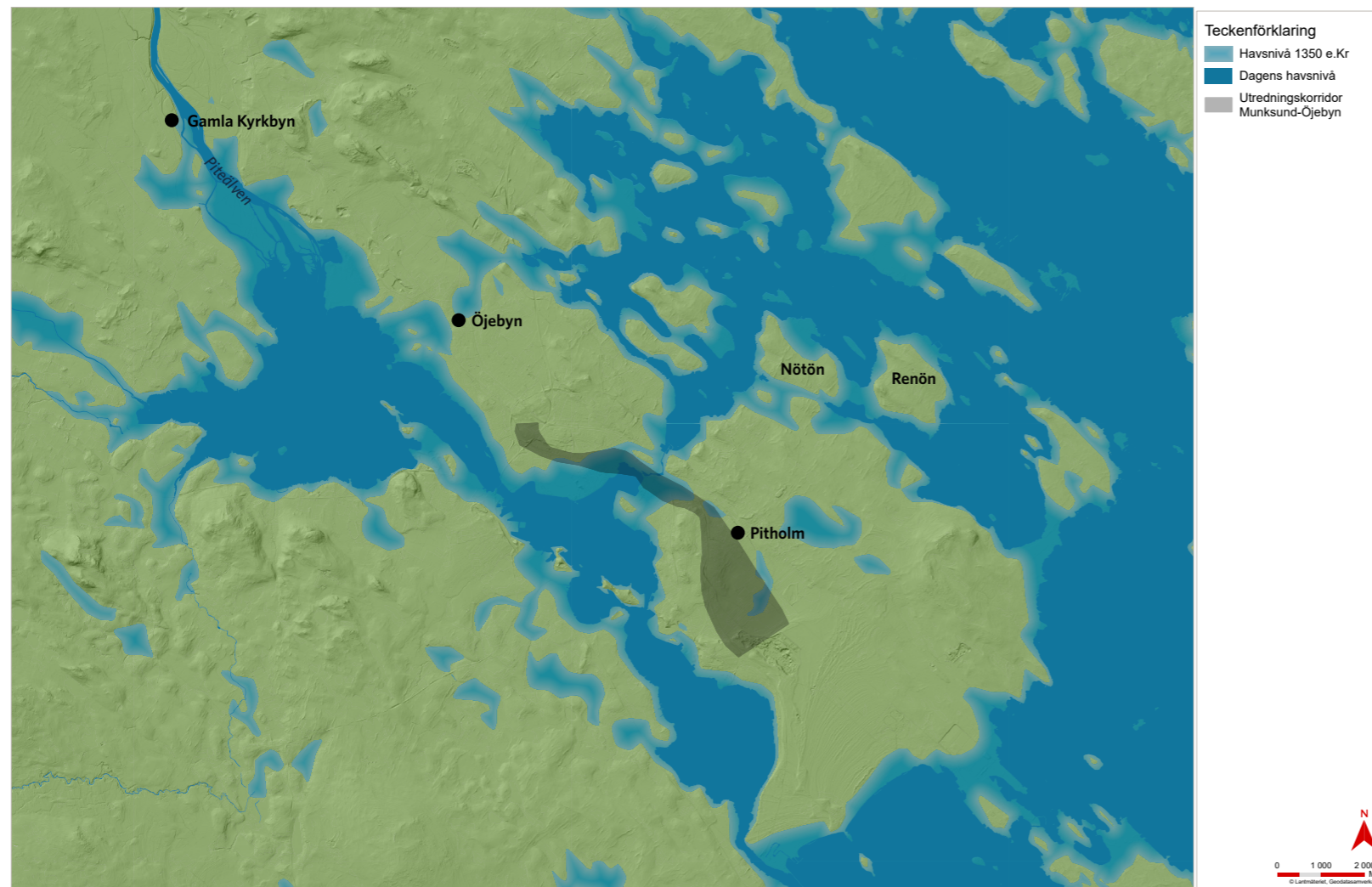
Figur 6. Strandnivåkarta ca 1350 e.Kr.

Frågan om stadsbildningar under 1500- och 1600-talet var laddad med olika intressen från bönder, borgare och kungamakten. Bönderna uppskattade friheten att kunna handla fritt, medan borgare i befintliga städer såg detta som ett hot mot sin egen verksamhet. Även kungamakten ville ha handeln förlagd till städer och fasta marknader där kronan kunde ha bättre kontroll och beskattningsmöjligheter. Gustav Vasa och hans söner drev en hård politik för att stoppa oreglerad handel utanför städer och marknadsplatser. Under 1570-talet började Johan III ställa folk från bland annat Medelpad, Ångermanland och Västerbotten (som då även omfattade dagens Norrbotten) inför rätta för så kallat landsköp. Bland dessa fanns kyrkoherden i Piteå, Andreas Nicolai. Då det vid den här tiden inte fanns några städer norr om Gävle ledde de hårda repressalierna mot landsköp till varu- och myntbrist i stora delar av norra Sverige.