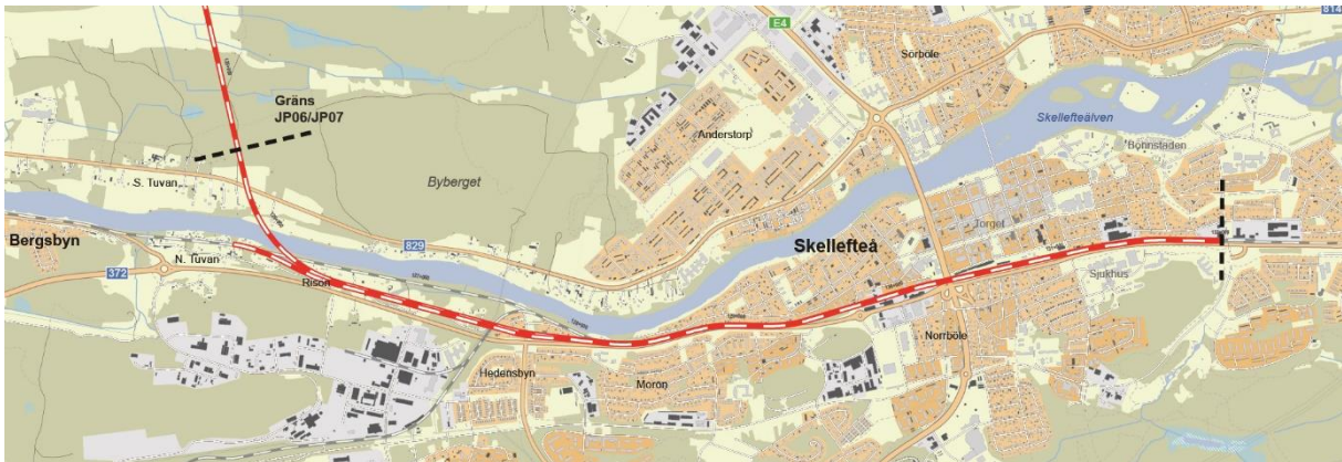
Figur 2. Järnvägsplan 07, sträckan Södra Tuvan – Skellefteå C

Trafikverket har påbörjat planläggningen av Norrbotniabanan mellan Umeå och Skellefteå. Denna planlägningsbeskrivning ger information om hur projektet Norrbotniabanan, delsträckan Södra Tuvan-Skellefteå C, kommer att planläggas, när allmänheten kan påverka samt vilka beslut som kommer att fattas.