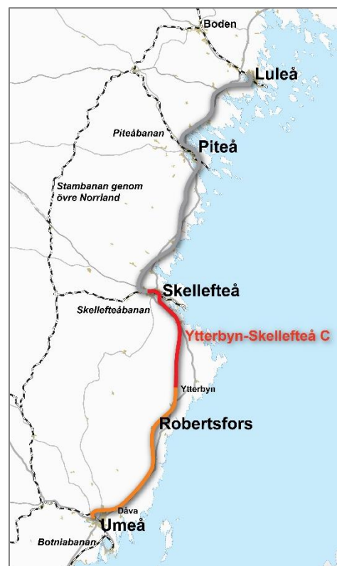
Figur 1. Norrbotniabanan med Etapp 1, Umeå Skellefteå och sträckan Ytterbyn-Skellefteå C.

En ny järnväg mellan Umeå och Luleå ger möjlighet till både tyngre och längre tåg. Med Norrbotniabanan beräknas företagens transportkostnader minska med upp till 30 procent. En sådan effektivisering får inte bara genomslag i norr utan i hela landet eftersom mer än hälften av den tunga godstrafiken kommer från norr med destination i söder. Norrbotniabanan innebär att den regionala persontrafiken mellan Umeå, Skellefteå, Piteå och Luleå kan utvecklas. Restiderna på sträckan kan med Norrbotniabanan halveras, något som förstärker möjligheterna till arbetspendling.