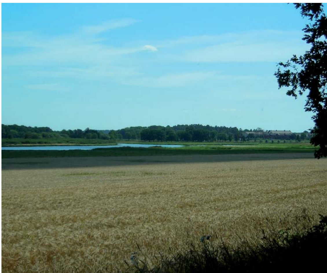
Vy över Ladugårdssjön från lokal grusväg mellan Vesterkvarn och Sofielund

odlingslandskap med mycket höga naturvärden, se karta på s 15 och 19. I området finns ekhagar, ädellövlundar, strandängar, åspartier, forsar, vassvikar och vattendrag. Kolbäcksån löper längs med Strömholmsåsen och utvidgas vid Strömsholm till en sjö. Norr om väg 523 mellan golfbanans klubbhus och Åsen finns sällsynta insekter (värmetsrelikter) i anslutning till en ås-skärning. Mellan golfbanan och väg 252 finns en våtmark. Strax söder om Kolbäck finns ett välformat åsparti, Kyrkbyåsen, med branta sidor, smal rygg och flera åskullar. Över 170 hotade arter finns i hela Natura 2000-området Strömsholm.