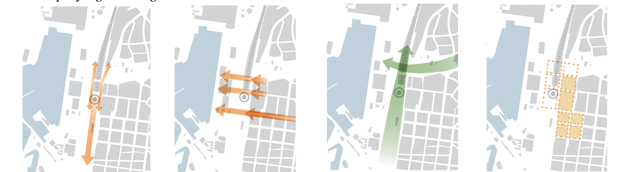
Skapa naturliga stråk och siktlinjer mot havet.