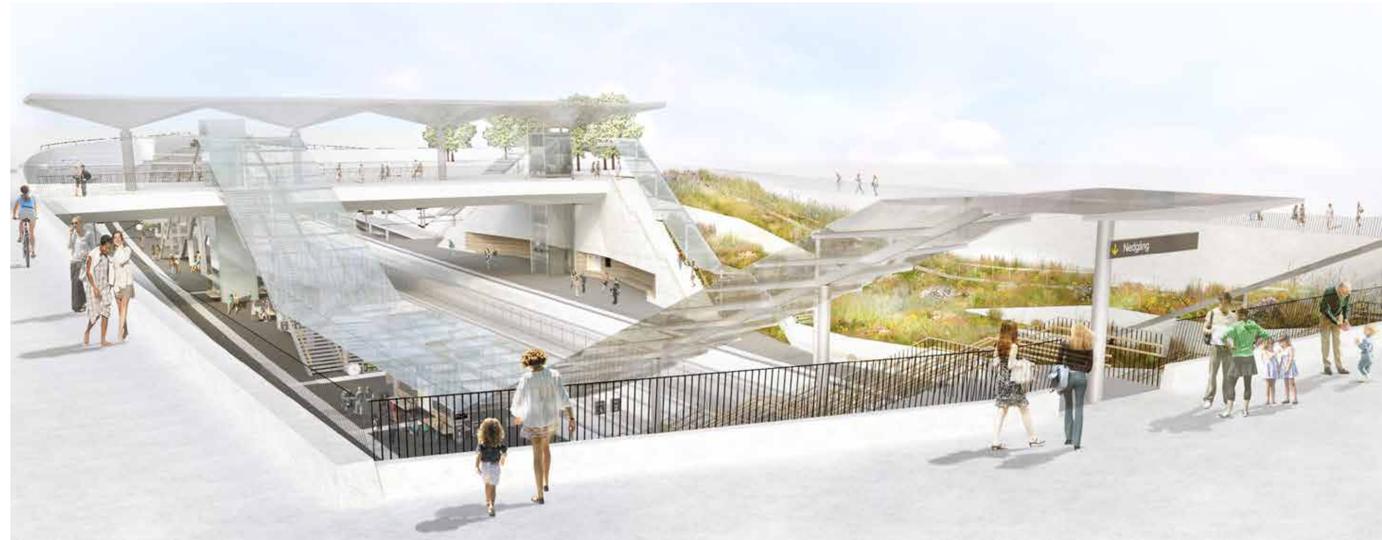
Vy från markplan vid södra uppgången.