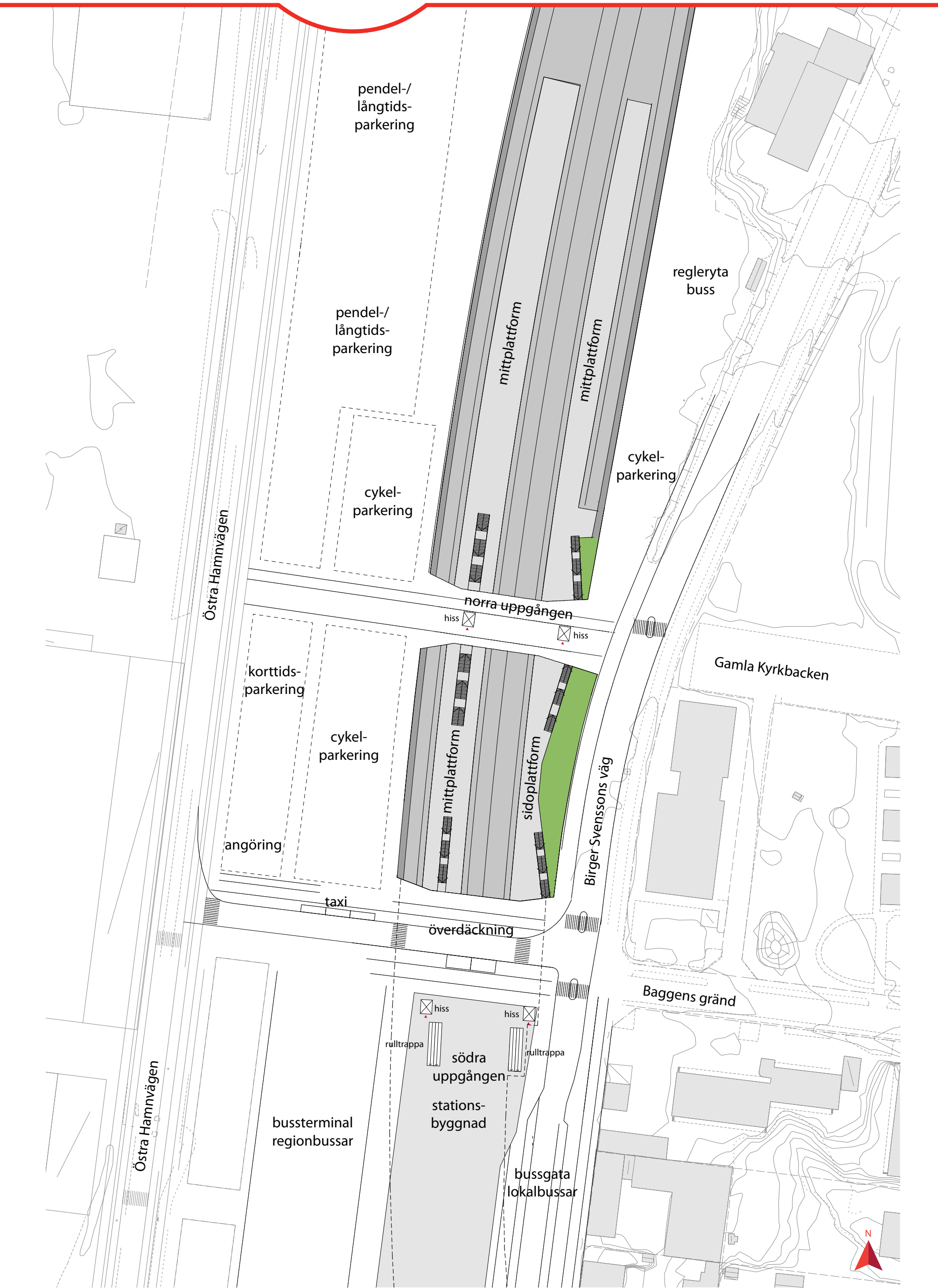
Möjlig utformning av stationsområdet. I järnvägsplanen ingår grå- och grönmärkade ytor. Övriga ytor för t.ex. cykelparkering hanteras i detaljplanen.