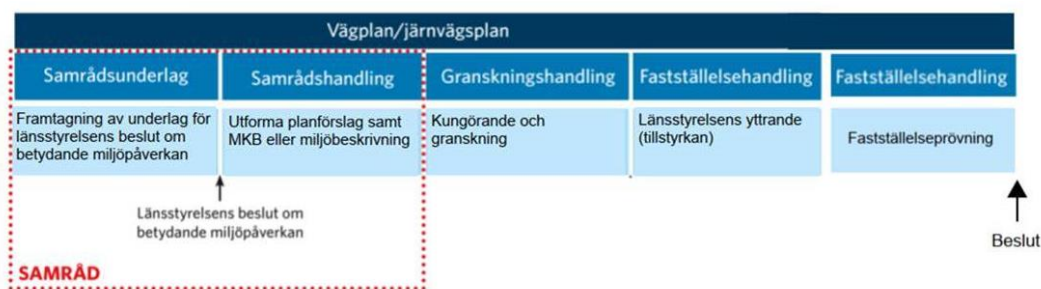
Figur 1. Planläggningsprocessen.

Byggstart kan ske tidigast då vägplanen vunnit laga kraft.