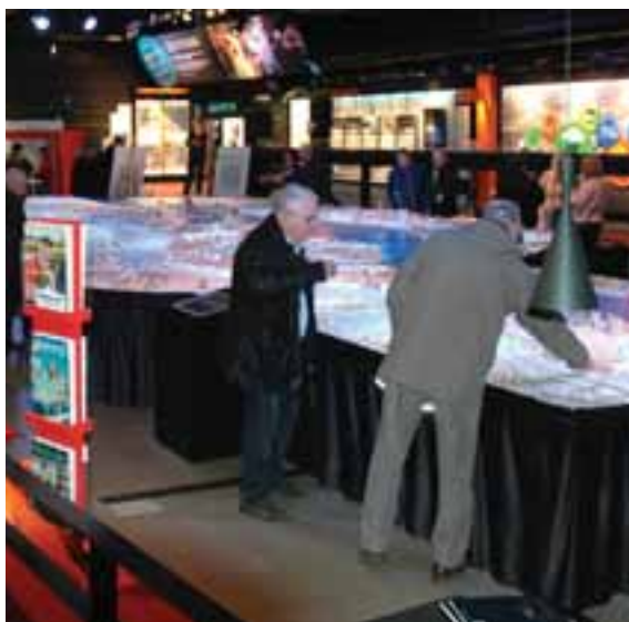
FIGUR 4.12. Utställning i Älvrummet november 2013.

Förslaget om ny anslutning till den befintliga Kust till kustbanan hindrar inga alternativ för framtida Götalandsbanan. Trafikverket står för samtliga kostnader för den detaljplan som behövs för den nya anslutningen.