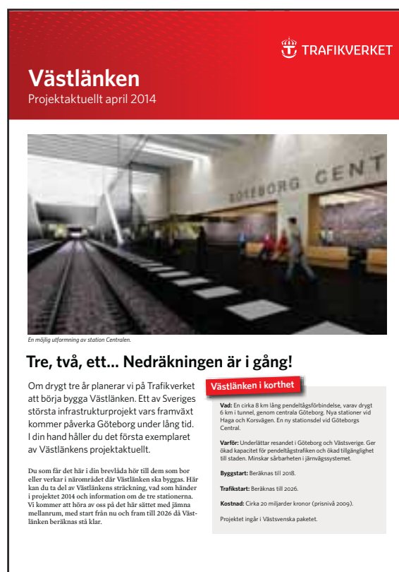
FIGUR 7.1. Projektaktuellt, framsida.

Trafikverket planerar att skicka ut ett informationsblad inför granskningen av järnvägsplanerna.