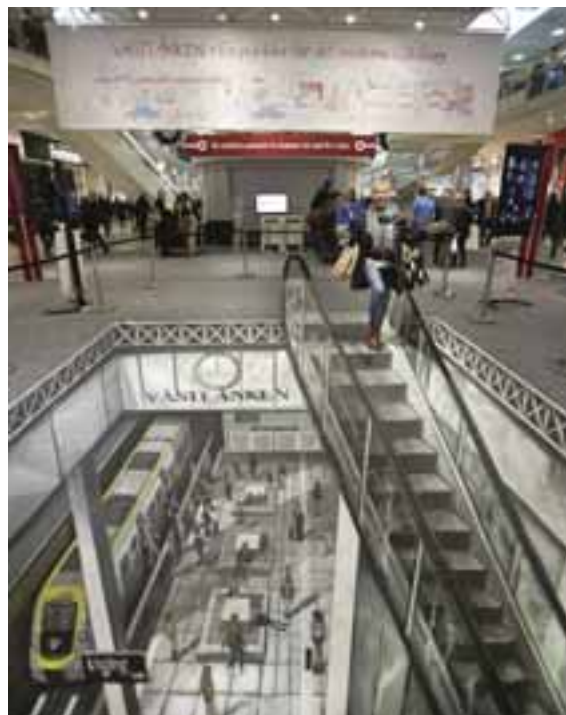
FIGUR 4.20. 3D-målning vid Göteborgs Stads utställning i Nordstan hösten 2014. Konstnär och foto: Joe Hill

Synpunkter under detta samråd kommer på grund av tiden att hanteras i samband med granskningen.