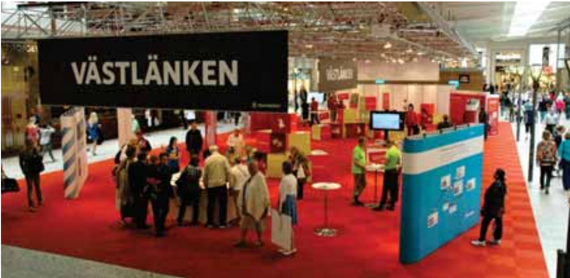
FIGUR 4.16. Utställning i Nordstan juni 2014.