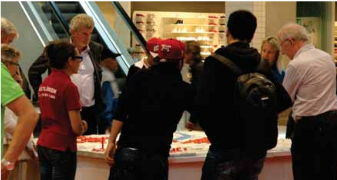
FIGUR 4.17. Diskussion vid Göteborgs Stads fysiska 3D-modell.