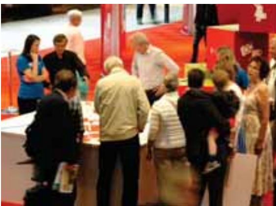
FIGUR 4.18. Diskussion vid 3D-modellen.