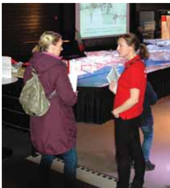
FIGUR 4.13. Utställning i Älvrummet november 2013, samtal.

Trafikverket kommer att samråda med berörda fastighetsägare med ambitionen att bli överens om föreslagna åtgärder.