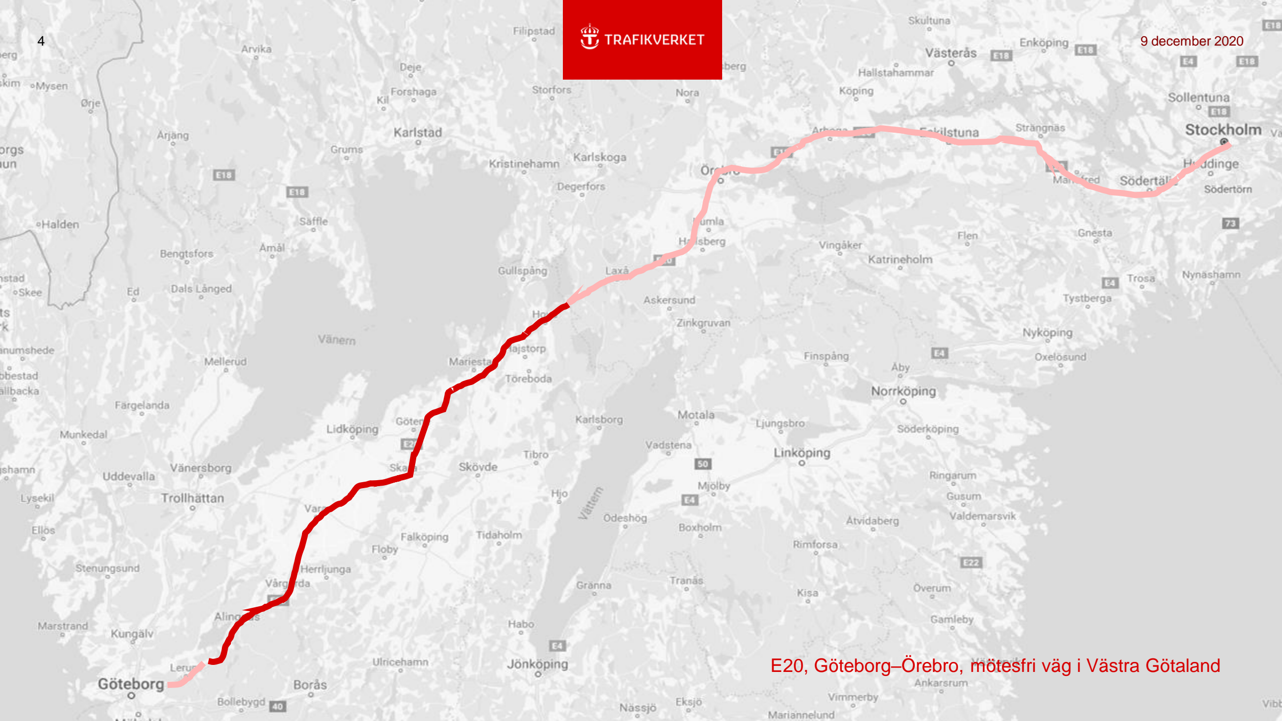
E20, Göteborg–Örebro, mötesfri väg i Västra Götaland