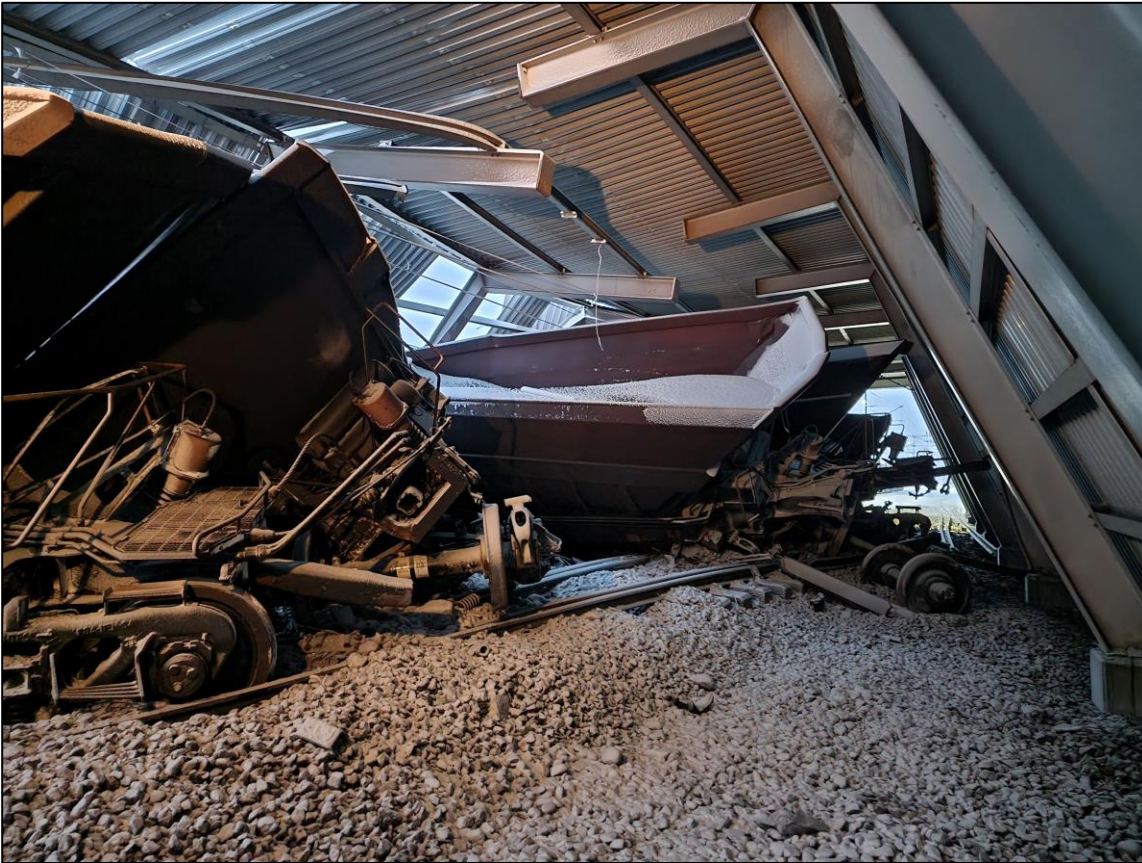
Urspårade vagnar i snögalleri i Vassijaure.