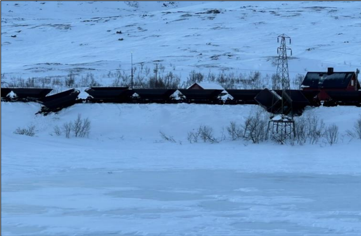
Urspårade vagnar.