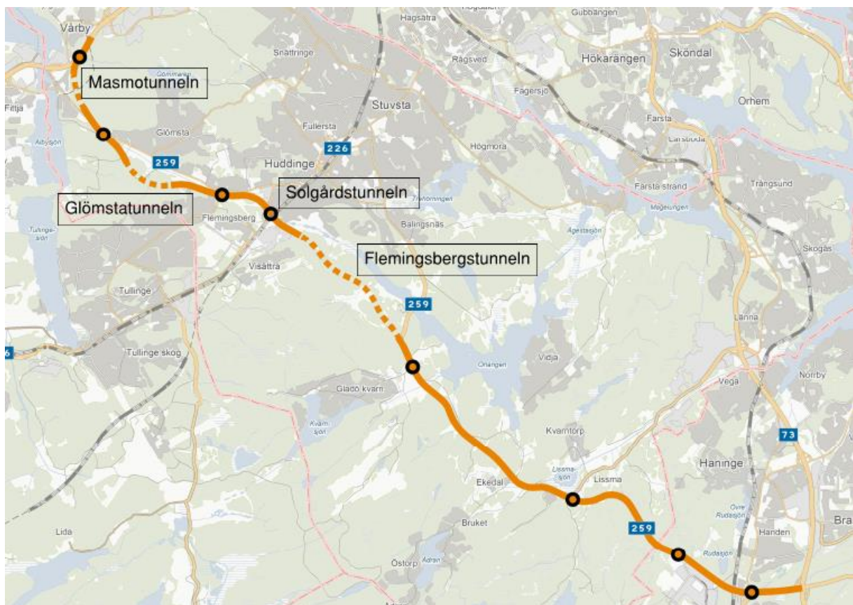
Figur 1 Illustration av linjeföring för Tvärförbindelsen. Streckad dragning innebär tunnelsträckning, förutom Solgårdstunneln som är för kort för att synas.

Tunnelanläggningarnas placering redovisas översiktligt i Figur 2 och beskrivs mer ingående i avsnitt 2.1-2.4.