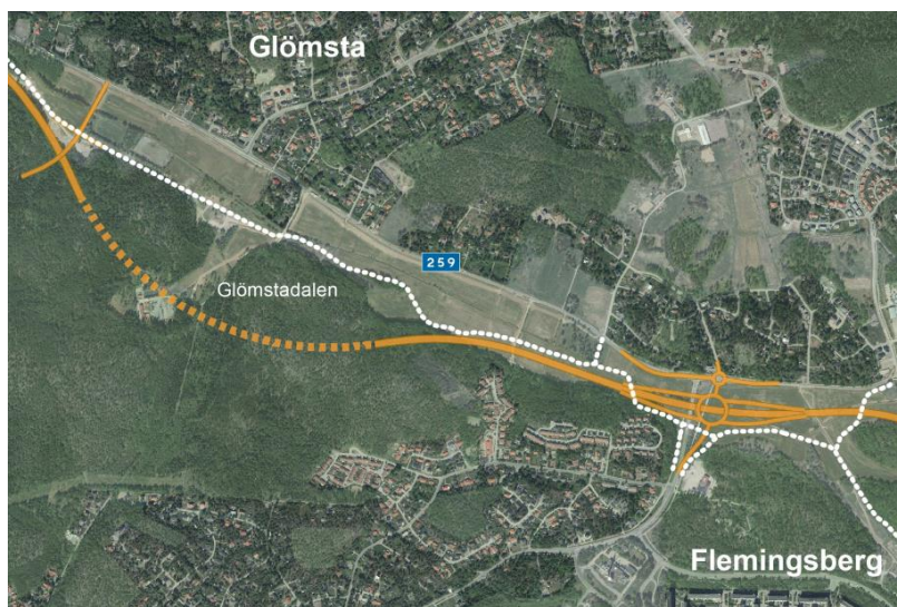
Figur 3 Glömstatunnelns linjeföring, väg i tunnel markerad med streckad gul linje. Vit streckad linje är gång- och cykelväg.