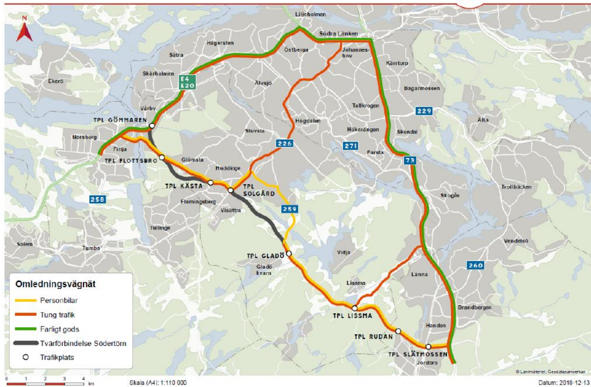
Figur 6 Planerat omledningsväg nät för Tvärförbindelse Södertörn, se oT140022, Framtagande av Vägplan, Tekniskt PM Trafik.