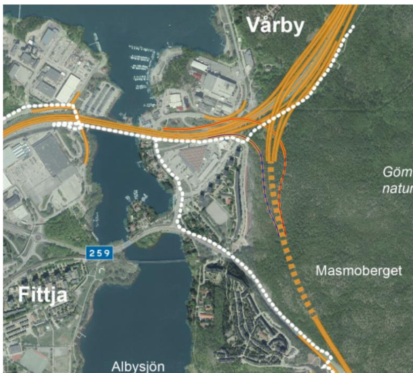
Figur 2 Masmotunnelns linjeföring, väg i tunnel markerad med streckad gul linje. Påfartsramp från E4/E20 S är markerad med blått och avfartsramp mot E4/E20 S med rött. Vit streckad linje är gång- och cykelväg.

Tunneln utförs huvudsakligen i berg med en kortare del, 110 meter, utförd i betong.