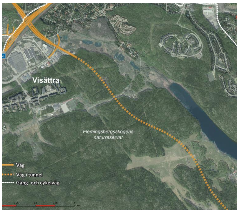
Figur 4 Flemingsbergstunnelns linjeföring, väg i tunnel markerad med streckad gul linje. Vit streckad linje är gång- och cykelväg.