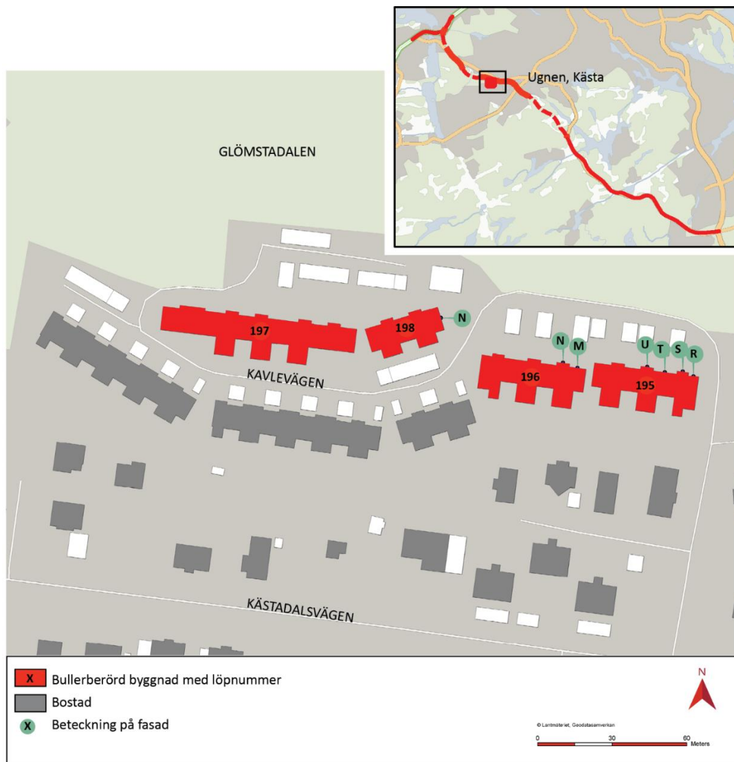
Figur 3 Kartan visar bullerskyddsåtgärder per fasad för fastigheten Ugnen 1 i Kästa.