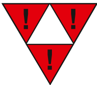
Figur 1. Varningsetikett nr 15

Innan skjutsning sker i riktning mot ett fordon eller en fordonsgrupp enligt uppräknigen ovan ska den som beslutar om igångsättning se till att två bromsskor eller en bromssläde är utlagda på ett sådant avstånd att det inte kan uppstå några stötar.