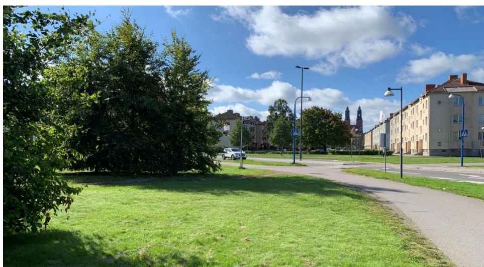
Figur 3.3 Vänster i bild syns trädgrupper i kvadrater av bokträd.

Några av trädplanteringarna och gräsytorerna kommer att påverkas av projektet, dessa beskrivs under kapitlet "Gestaltningförslag".