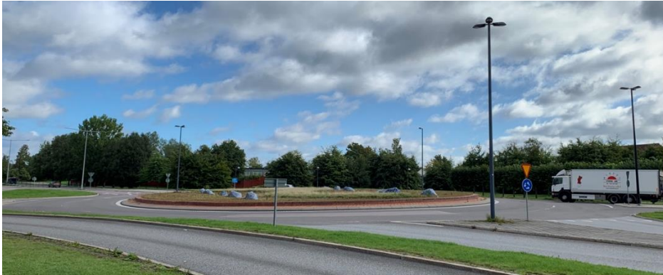
Figur 3.1 Cirkulationsplatsen har en utsmyckning av rött grus, en slingrande gräsyta med cortenstålskant samt blå mosaikfigurer.

Väg 53 ligger inom stadsmiljö. Cirkulationsplatsen har en utsmyckning av rött grus, en slingrande gräsyta med cortenstålskant samt blå mosaikfigurer som höjer sig ur gruset. Cirkulationens utformning kommer att bevaras och den kommer inte att påverkas av detta projekt.