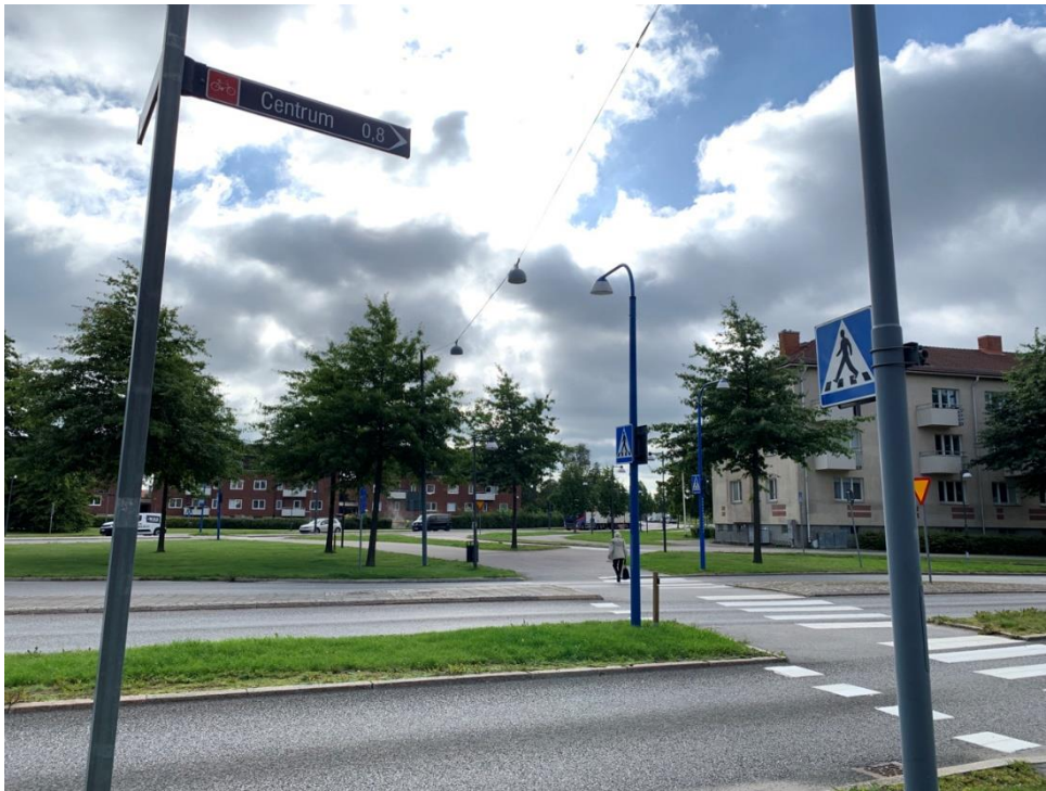
Figur 5.2 Belysningsstolpar invid övergångsställen är blålackerade.