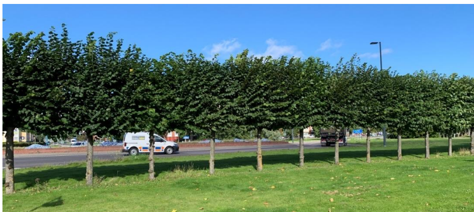
Figur 3.2 Spaljéklippt bohuslind.