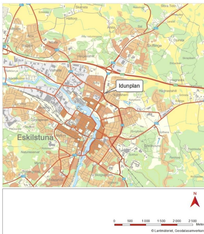
Figur 1.1 Översiktskartan visar placering av cirkulationsplatsen Idunplan.