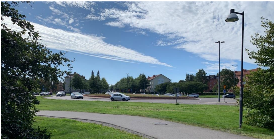
Figur 4.1 Väg 53 är ett betydande trafikstråk och en viktig infart till Eskilstuna.

Utredningsområdet ligger inom tätbebyggt området där många människor bor, vistas och passerar. Det är därför av stor vikt att skapa en trafiksäker, funktionell och tillgänglig miljö för cyklister och fotgängare. Dessutom utgör väg 53 ett betydande trafikstråk i Eskilstunas övergripande trafiknät samt en viktig infart till Eskilstuna, vilket förstärker behovet av en välkomnande och gestaltad entré.