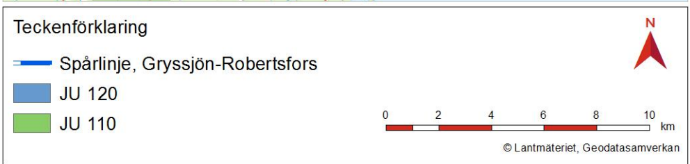
Figur 2. Planförslag för JP03.