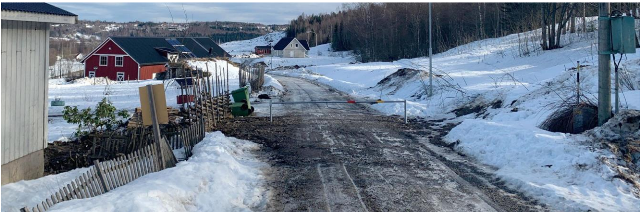
Vi vill redan nu flagga för bullerstörande arbeten i och kring Maland och Västland.

Under våren räknar vi med att komma i gång med bygget av ny järnväg i Maland på allvar. Det kommer att påverka dig som bor och rör dig i området på olika sätt. Här kan du läsa mer om de planerade arbetena och vilka störningar de kan orsaka.