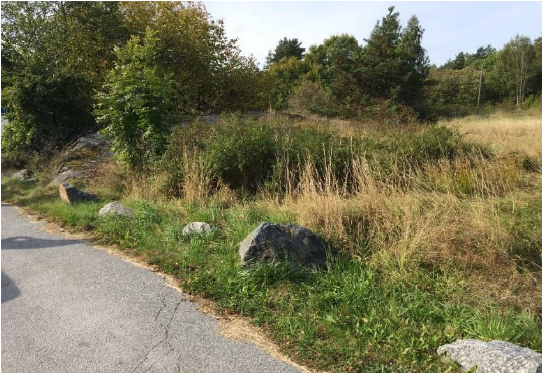
Figur 4. Naturmark med triviala värden strax norr om dagens infartsparkering

Området runt korsning och parkering utgörs av naturmark med öppen gräsyta och inslag av trädbuskage av trivial karaktär. Närområdet hyser inga kända naturvärden förutom orkidén Eva och Adam. En fridlyst art som växer i torra gräsmarker och i klippskrevor, främst i kustnära trakter. Enligt förstudien finns orkidén i sluttningen norr om bussbytespunkten. Ingen naturvärdesinventering har genomförts då arbetet med vägplanen inleddes hösten 2015, och inventeringssäsong av kärlväxter i fält är maj-juni. Markanspråket är dessutom begränsat och inrymmer inte sluttningen norr om busshållplatsen. I trädningen intill cykelparkeringen söder om väg 1003 står en gammal ask som bör bevaras (Förstudie 2011).