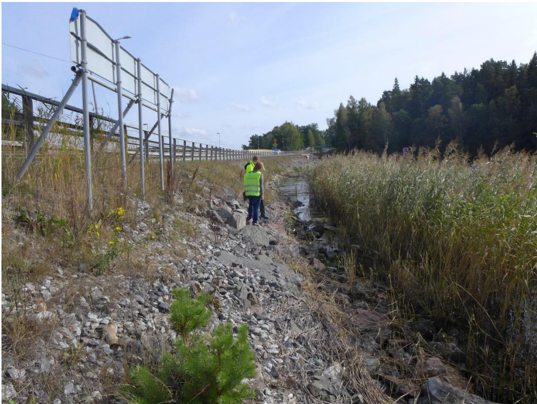
Figur 2. Bilden visar vägbanken i södergående riktning.