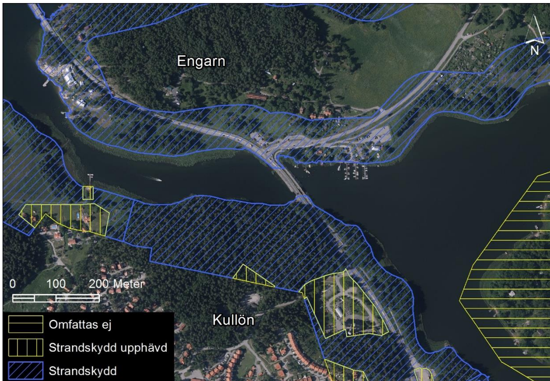
Figur 1. Bilden visar strandskyddets utbredning på land vid normalvattentillstånd. Strandskyddet sträcker sig även från strandlinjen 100 meter ut i vatten.