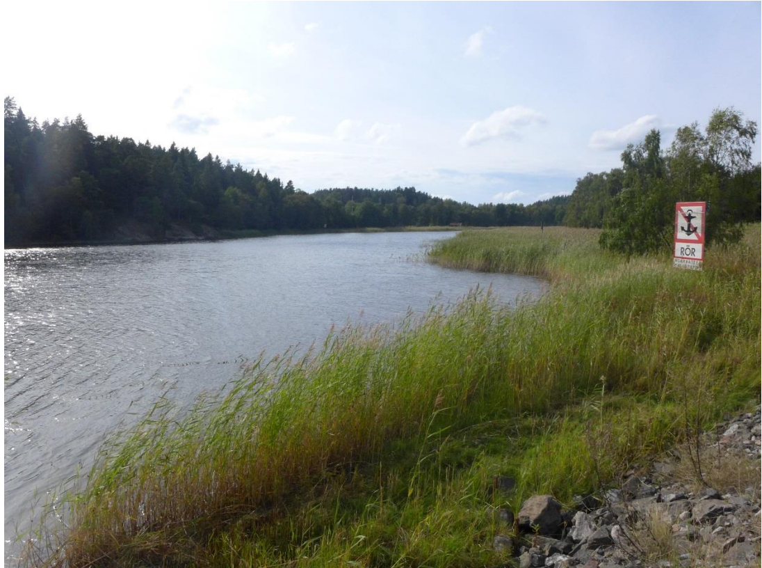
Figur 3. Utblick västerut över Engarnsundet.