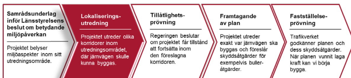
Figur 1. Projekt Hässleholm-Lund är i den fas som heter lokaliseringsutredning, som här är rödmarkerad.

Planlägningsprocessen kommer för det här projektet att innehålla fem faser. Dessa beskrivs kort i figur 1 och mer utförligt i texten nedanför. Projekt Hässleholm-Lund är i den fas som heter lokaliseringsutredning.