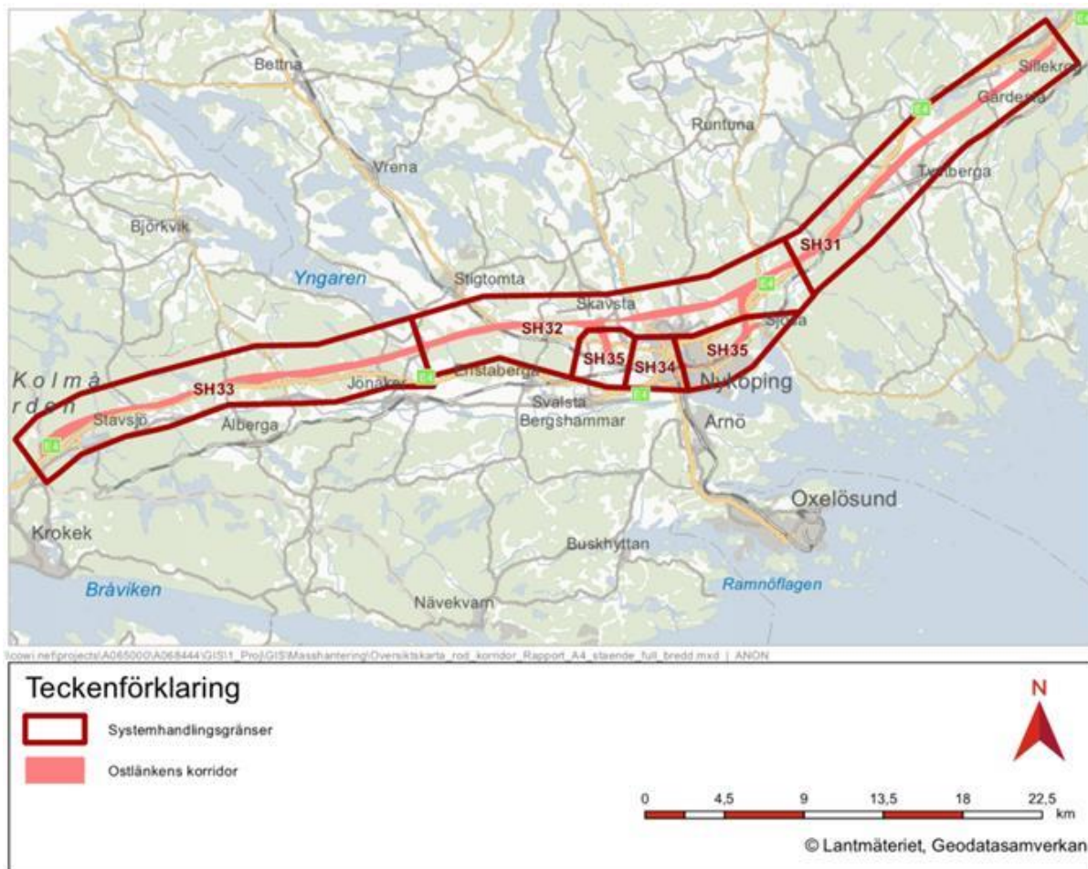
Figur 2. Översikt över gränser för järnvägsplaner och systemhandlingar för sträcka 31 - 35 inom Ostlänken, delprojekt Nyköping.