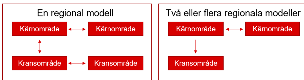
Figur 2. Skalning i Samkalk.

OM användaren har valt att exekvera >1 regional modell (ex. Palt och SAMM, eller Palt, SAMM, Väst, Sydost, Skåne) ska vid samtliga matrisberäkningar enbart relationer som produceras inom respektive regional modells kärnområde och attraheras inom respektive regional modells kärn- eller kransområde beräknas.