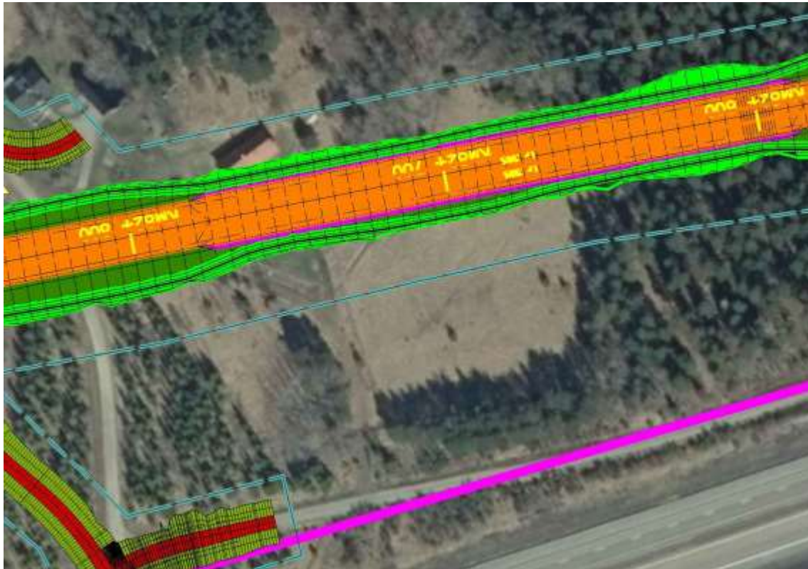
Figur 5. Byggnad utmed delsträcka 33 som förutsätts lösas in.

Byggnader nära spår på nya stambanan (inom ca 50 meter) är fåtaliga på sträckan och utgörs av bostadshus eller ekonomibyggnader. Totalt rör det sig om åtta platser utmed den planerade linjen som bebyggelse ligger inom 50 meter. Av dessa är det endast två som ligger inom urspårningsavstånd, 20-25 meter. De berörs dock båda av själva banans uppbyggnad och förutsätts lösas in. Förbi den ena platsen med spårnära bebyggelse (km 85+200) ligger banan dessutom i skärning vilket innebär att ett tåg inte kommer lämna spårområdet i samband med en urspårning. Den andra platsen redovisas i figur 5 och är lokaliserad till km 82+750.