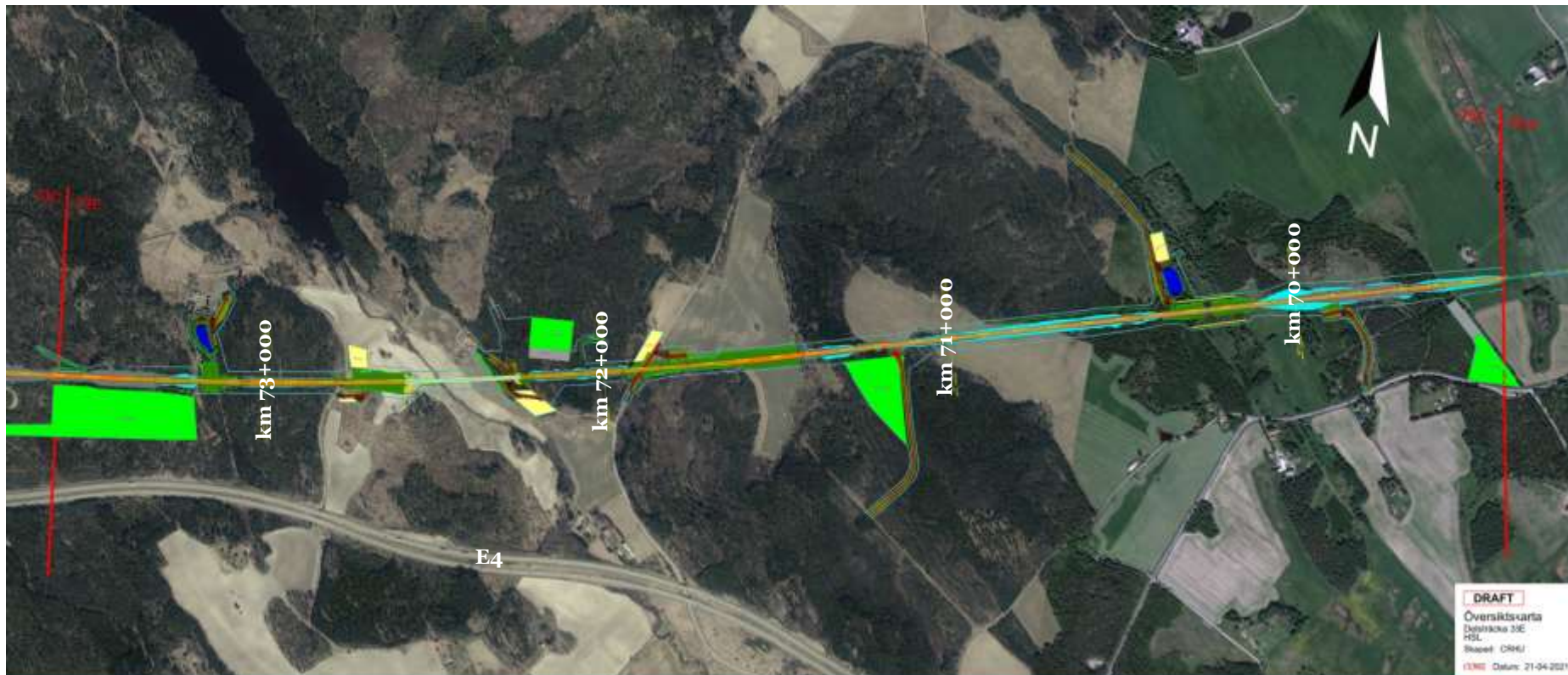
Figur 1. Delsträcka 33E.