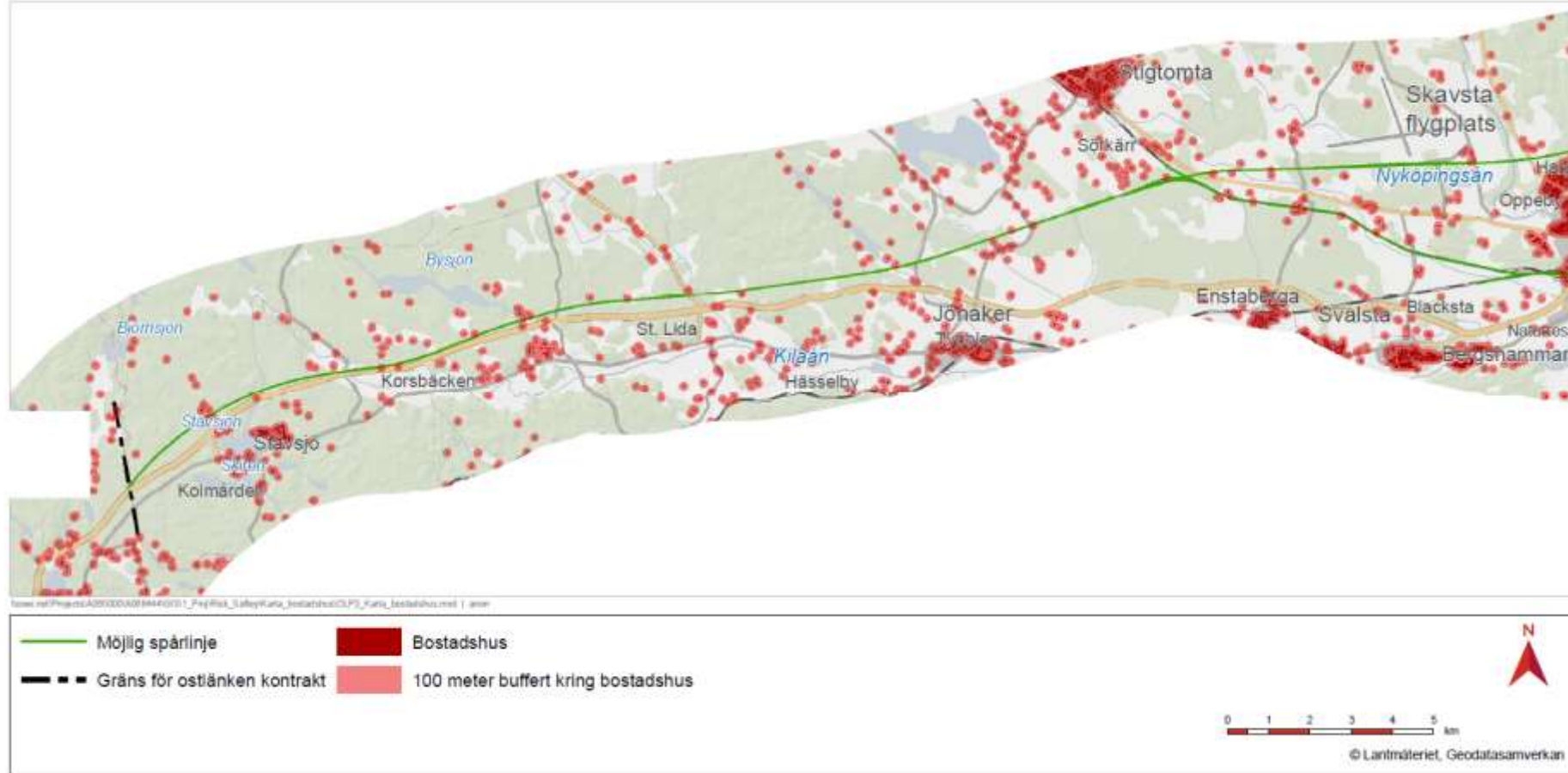
Figur 4. Översikt över bostadshus inklusive buffertzonen på 100 meter, JP33.