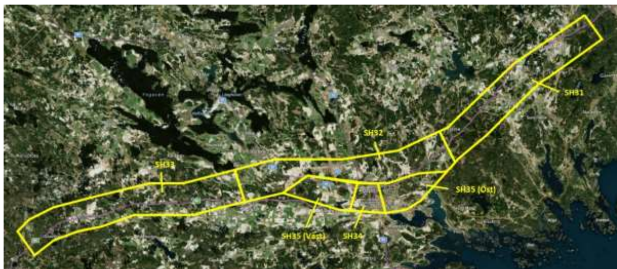
Figur 2. Järnvägsplanegränser.