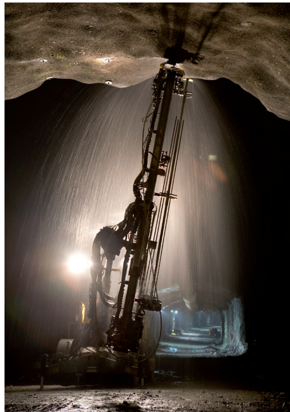
Figur 50 Tättningsarbeten vid byggande av Norra länken.