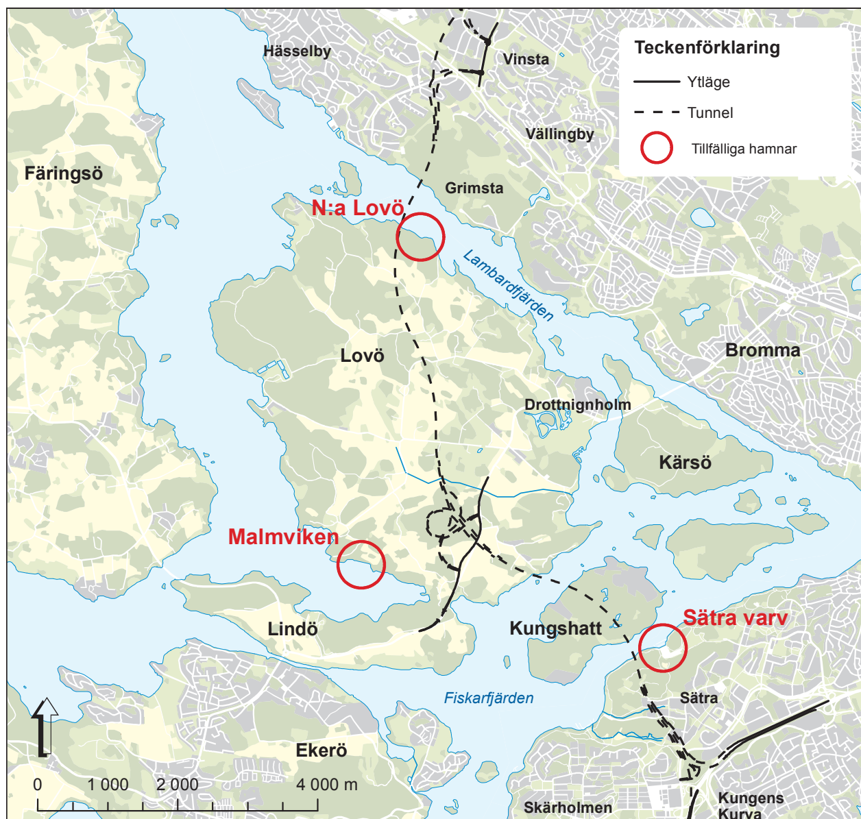
Figur 48 Lägen för tillfälliga hamnar.

Kalkylerad totalkostnad för vägförslaget i 2009 års prisnivå är cirka 27,6 miljarder kronor. Detta pris inkluderar förutom direkta byggkostnader även kostnader för projektledning, projektering och marklösen. Av kostnaderna är drygt hälften kostnader för huvudtunnlarna. Kostnaderna för trafikplatserna är cirka nio miljarder kronor och installationer svarar för cirka fyra miljarder.