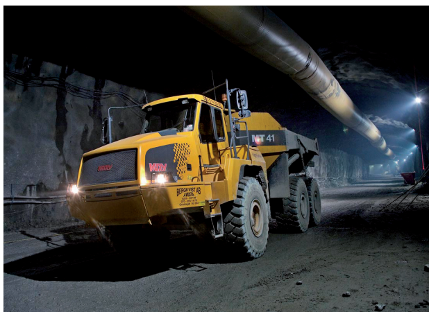
Figur 52 Masstransport vid tunneldrivning.