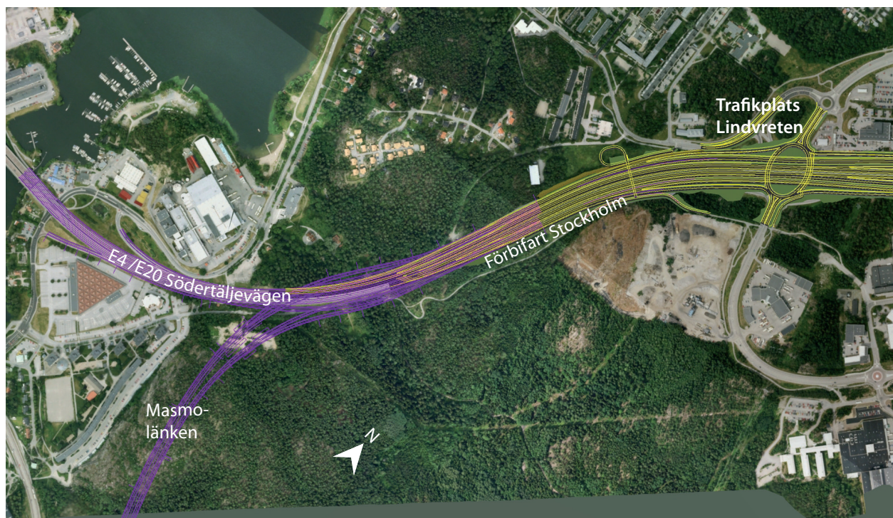
Figur 24 Ett fotomontage över den planerade Masmolänken (lila) där den ansluter E4/E20 och den planerade E4 Förbifart Stockholm (gult).

Från trafikplats Vårby till en ny, ännu inte namngivna trafikplats vid Kungens kurva, följer E4 Förbifart Stockholm den befintliga vägens sträckning. Efter den nya trafikplatsen påbörjas sänkningen av profilen ner mot tunnelpåslaget, som ligger i höjd med cirkulationsplatsen i Dialoggatans norra ände. Därifrån går vägen i tunnel under Mäläröarna, Hässelby, Vinsta och Lunda fram till trafikplats