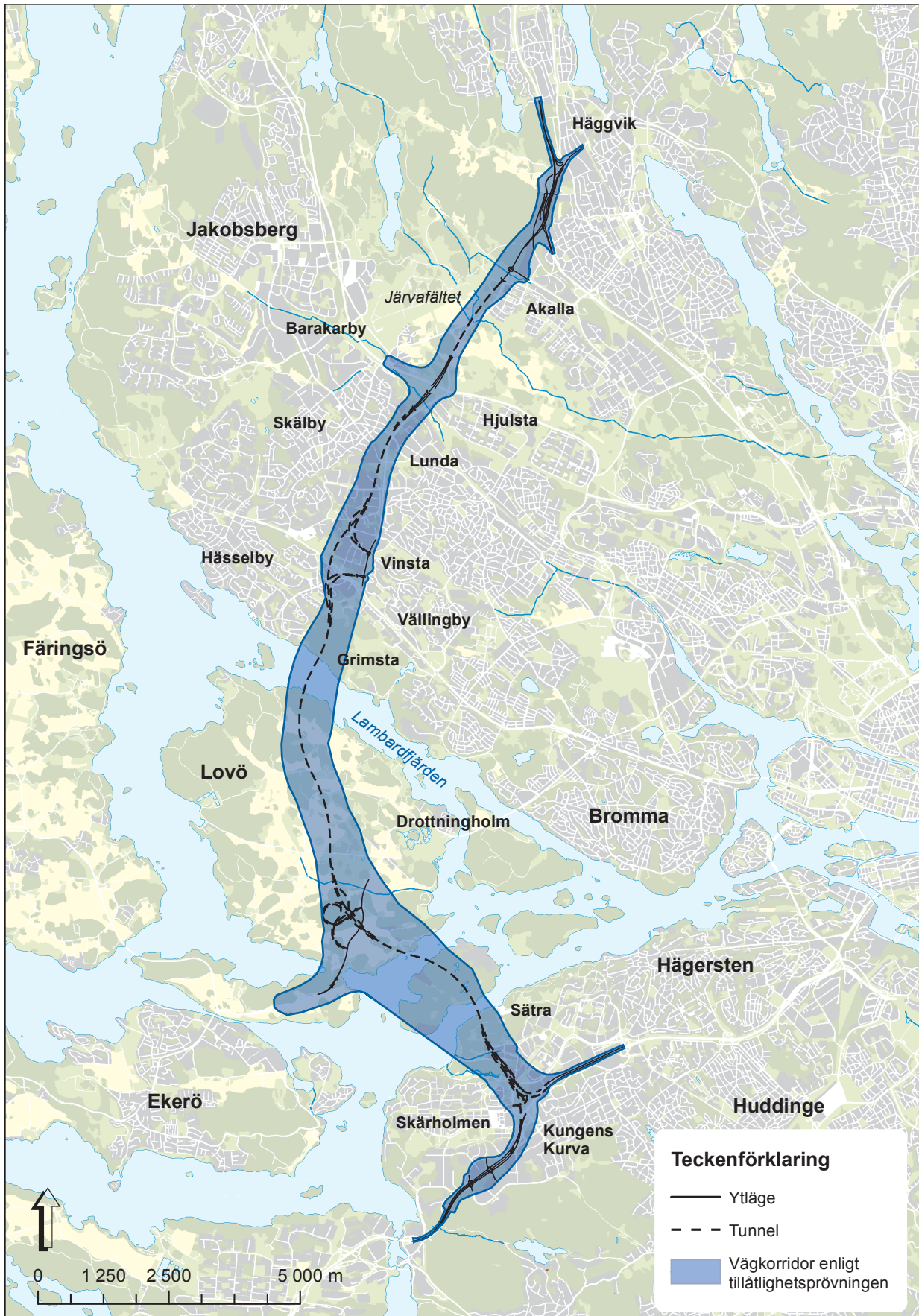
Figur 18 Korridor för E4 Förbifart Stockholm