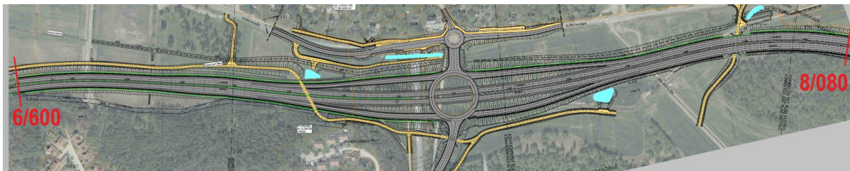
Figur 1 – Översiktsbild över delområde 3.

För att undvika upprepning av text som är gemensam för alla delområden behandlas övergripande krav och förutsättningar i dokument OGI40010.doc, PM Geoteknik, Gemensamt.