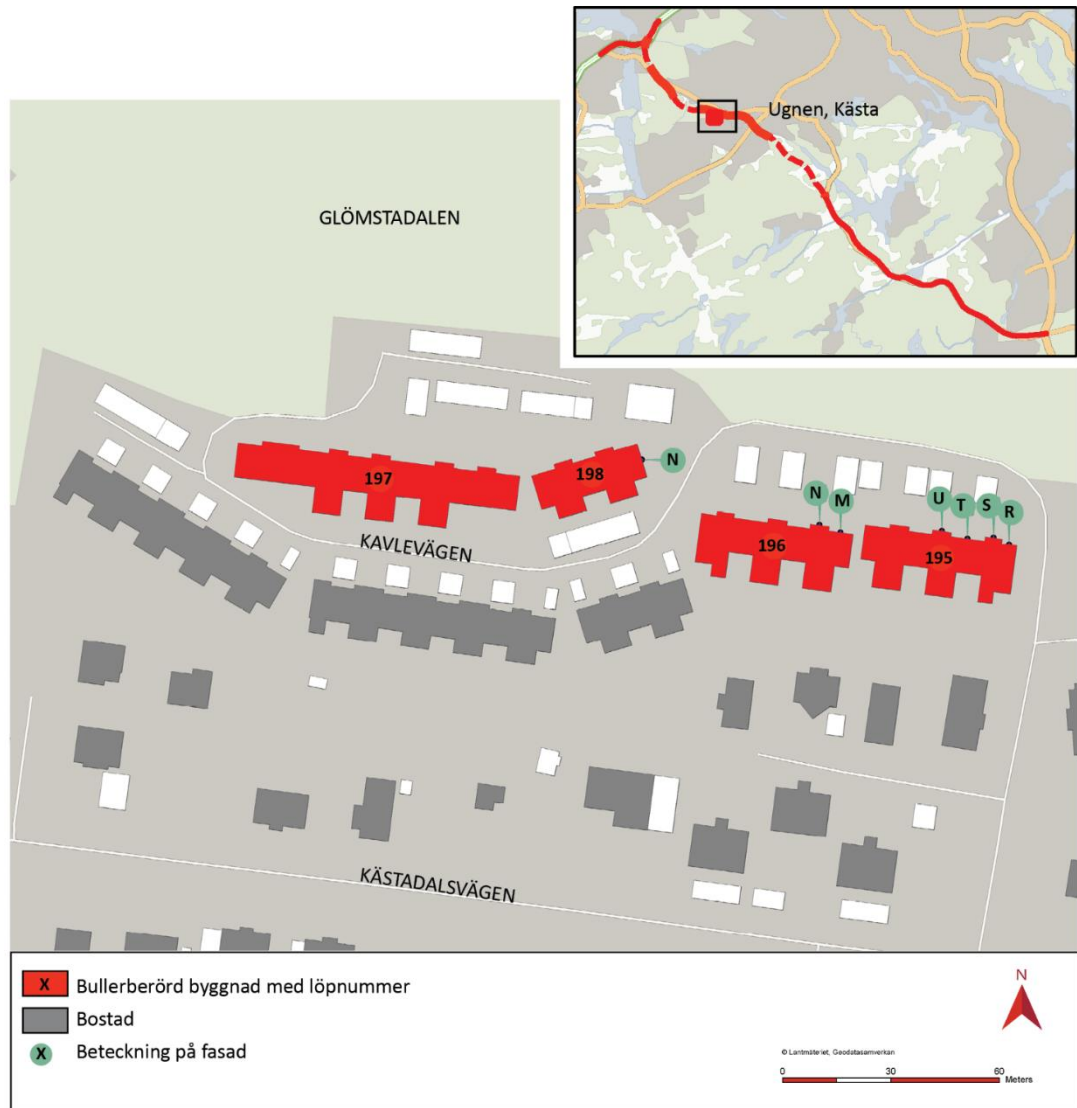
Figur 3 Kartan visar bullerskyddsåtgärder per fasad för fastigheten Ugnen 1 i Kästa.