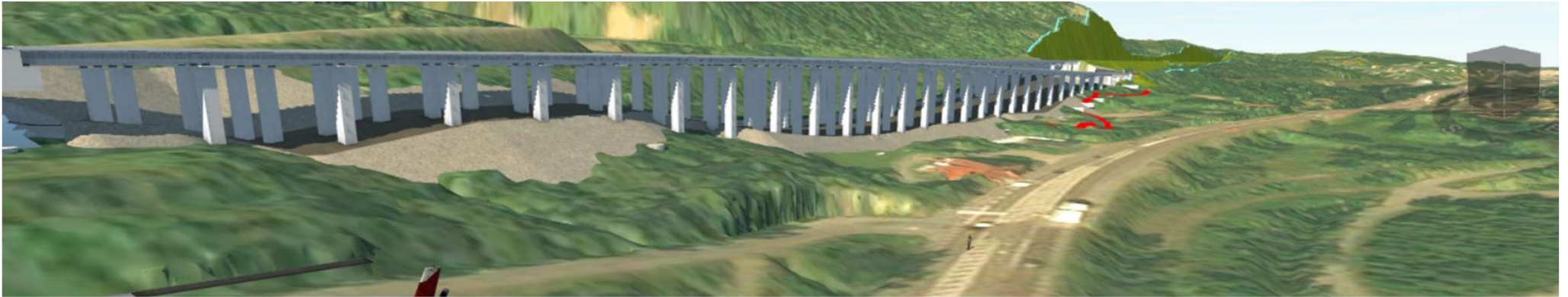
Nytt förslag: Landbro