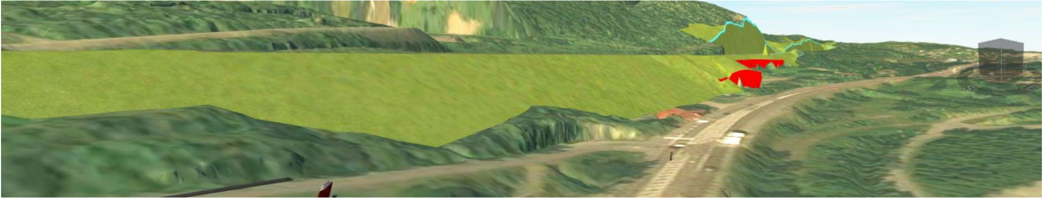
Tidigare lösning: Tänkt banklösning i ljusgrönt, stödmur i rött