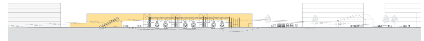
Förslag till ny station med spår i markförlagt läge.

Ekonomi – investerings- och underhållskostnader.