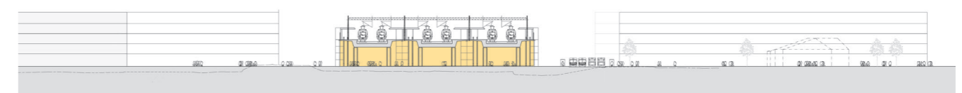
Förslag till ny station med spår i upphöjt läge.