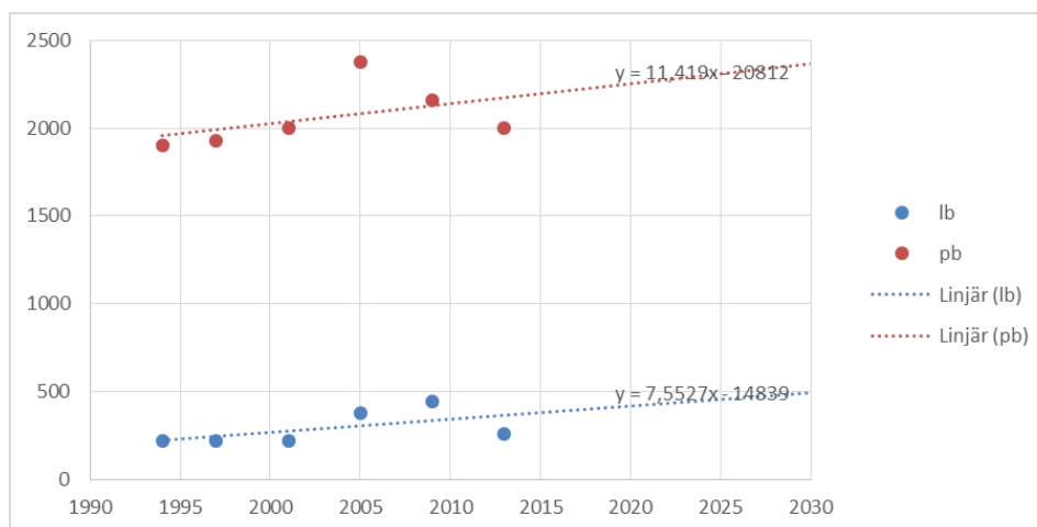
Figur 3. Exempel på trendframskrivning.

Om det inte finns relevanta mätvärden på aktuell sträcka kan man använda mätpunkter på intilliggande delar av stråket.