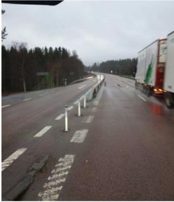
Figur 5, Traktoröverfart med markeringsstolpar 7 december 2020