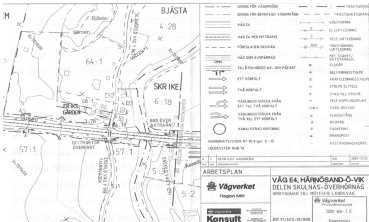
Figur 2, Utsnitt ur arbetsplan, 101T0207, projekt Väg E4 Härnösand-Ö-vik. delen Skulnäs-Överhörnäs

Det finns idag behov av att förbättra trafiksäkerheten i korsningen E4/Tjärnvägen. Där finns möjlighet att passera E4:an med gång- och cykeltrafik i plan samt med traktor (motorredskap), enligt arbetsplan fastställd 2009-03-10, se figur 2.