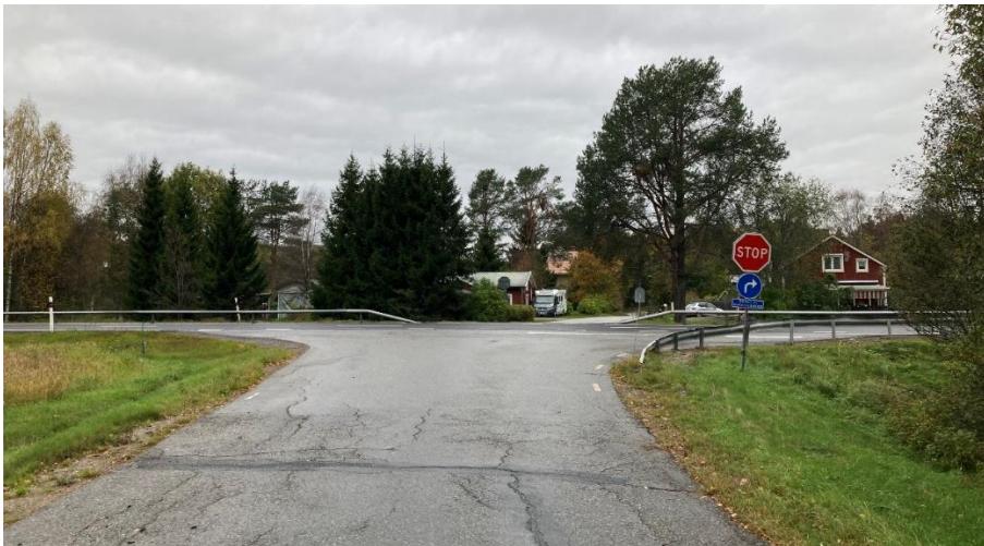
Figur 4, Anslutning E4/Tjärnvägen med blick åt väster (2023-10-03)

I december 2020 satte Trafikverket upp tre markeringsstolpar, s.k. vikkäppar, i gång-, cykel- och traktoröverfarten. En vecka senare hade markeringsstolparna rivits bort, se figur 5 och 6.