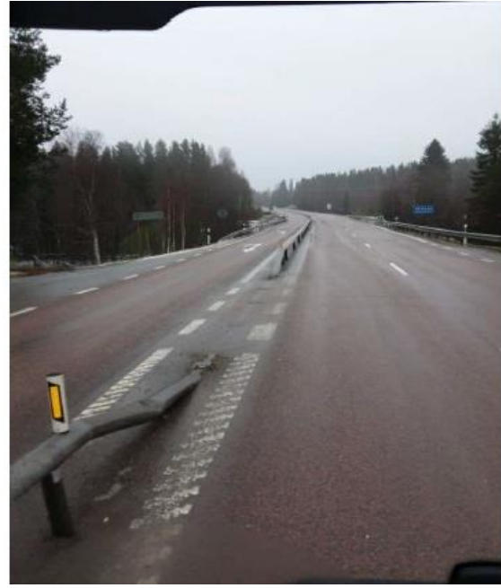
Figur 6, Traktoröverfart med bortrivna markeringsstolpar 14 december 2020