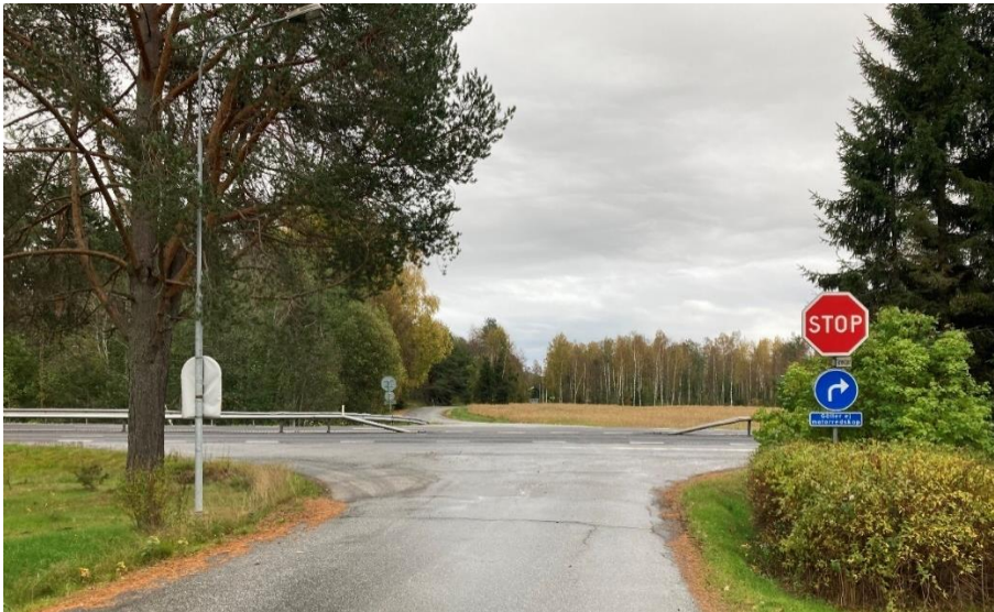
Figur 3, Anslutning E4/Tjärnvägen med blick åt öster (2023-10-03). På tilläggstavlan står det "Gäller ej motorredskap".

Skyltning och befintliga trafikregler i korsningen begränsar fordonstrafiken redan idag. Det är vänstersvängsförbud på E4:an och påbud höger ut från Tjärnvägen, se figur 3 och 4. Det innebär alltså att korsningen inte är konstruerad som en normal fyrvägskorsning. Öppningen i mitträcket är idag cirka 10 meter bred och ger på så sätt trafikanterna möjlighet att olovligen svänga vänster.