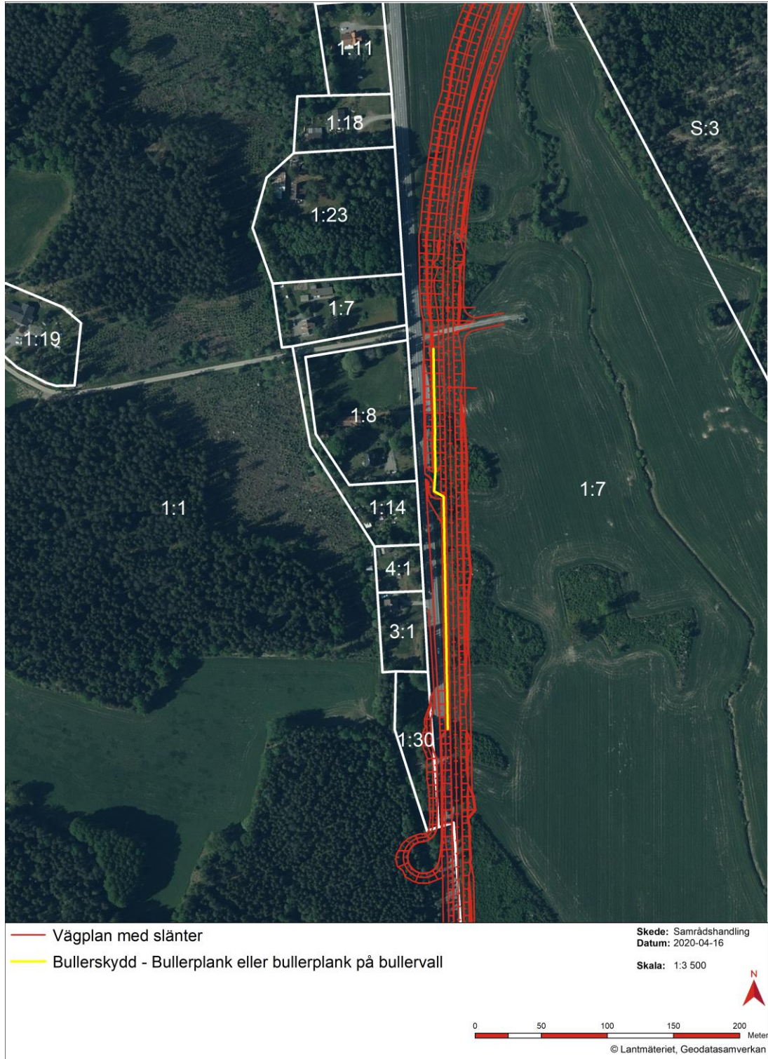
Figur 2. Bullerplank syns som gul linje i kartan. Illustration: Tyréns AB.