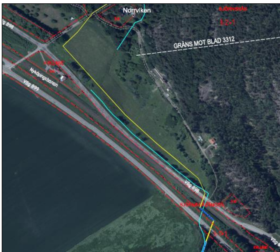
Figur 3. Utsnitt från OLP2-10GR-114-21-102_103-3319 status granskningshandling (före ändring av ledningsplacering).