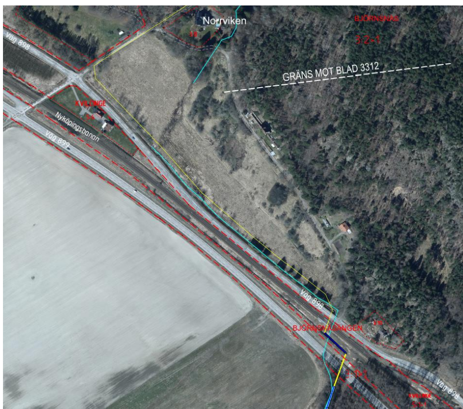
Figur 4. Utsnitt från OLP2-10GR-114-21-102_103-3319 status fastställelsehandling (efter ändring av ledningsplacering).