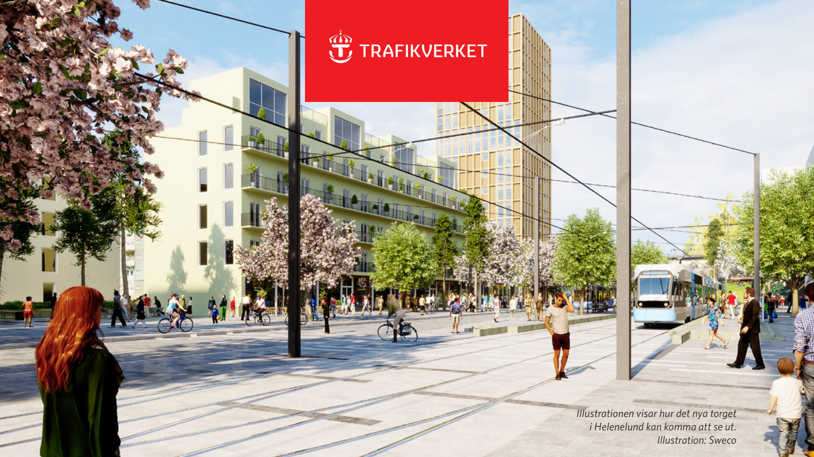
Illustrationen visar hur det nya torget i Helenelund kan komma att se ut. Illustration: Sweco